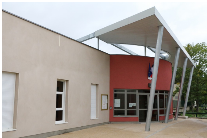
La toute nouvelle école maternelle a ouvert ses portes à l'occasion de cette rentrée.