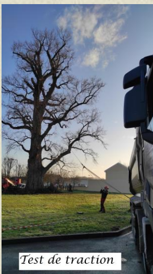
Test de traction