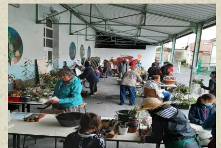
Chaque organisateur et participant a été soumis à la vérification stricte du Pass sanitaire pour entrer

Le dimanche 3 octobre a eu lieu pour la première fois le troc des jardiniers d'automne après un long arrêt que tout le monde comprendra. Ce fût une après-midi réussie avec beaucoup de visiteurs passionnés parfois venus de loin avec beaucoup d'échanges, de conseils et des animations, comme l'atelier de poésies, l'atelier de boutures ou encore de couronnes de fleurs. Tous les visiteurs y ont trouvé leur bonheur et ont apprécié ce moment d'échange. Nous espérons vous y retrouver pour notre prochaine manifestation au printemps.